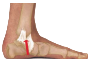
Inderside af ankelled

Hyppigste forstuvning. Ledbåndsskade - fortil ved leddet.