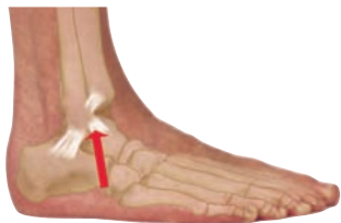
Yderside af ankelled

Hyppigste forstuvning. Ledbåndsskade - fortil ved leddet.